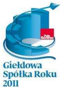
RAPORTY Giełdowa Spółka Roku 2011