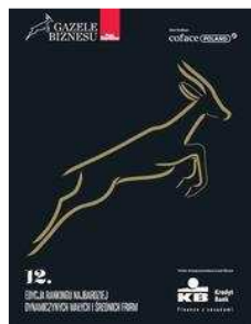
RAPORTY Katalog Gazel Biznesu 2011