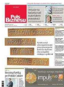
PRENUMERATA Kup bieżące e-wydanie Pulsu Biznesu